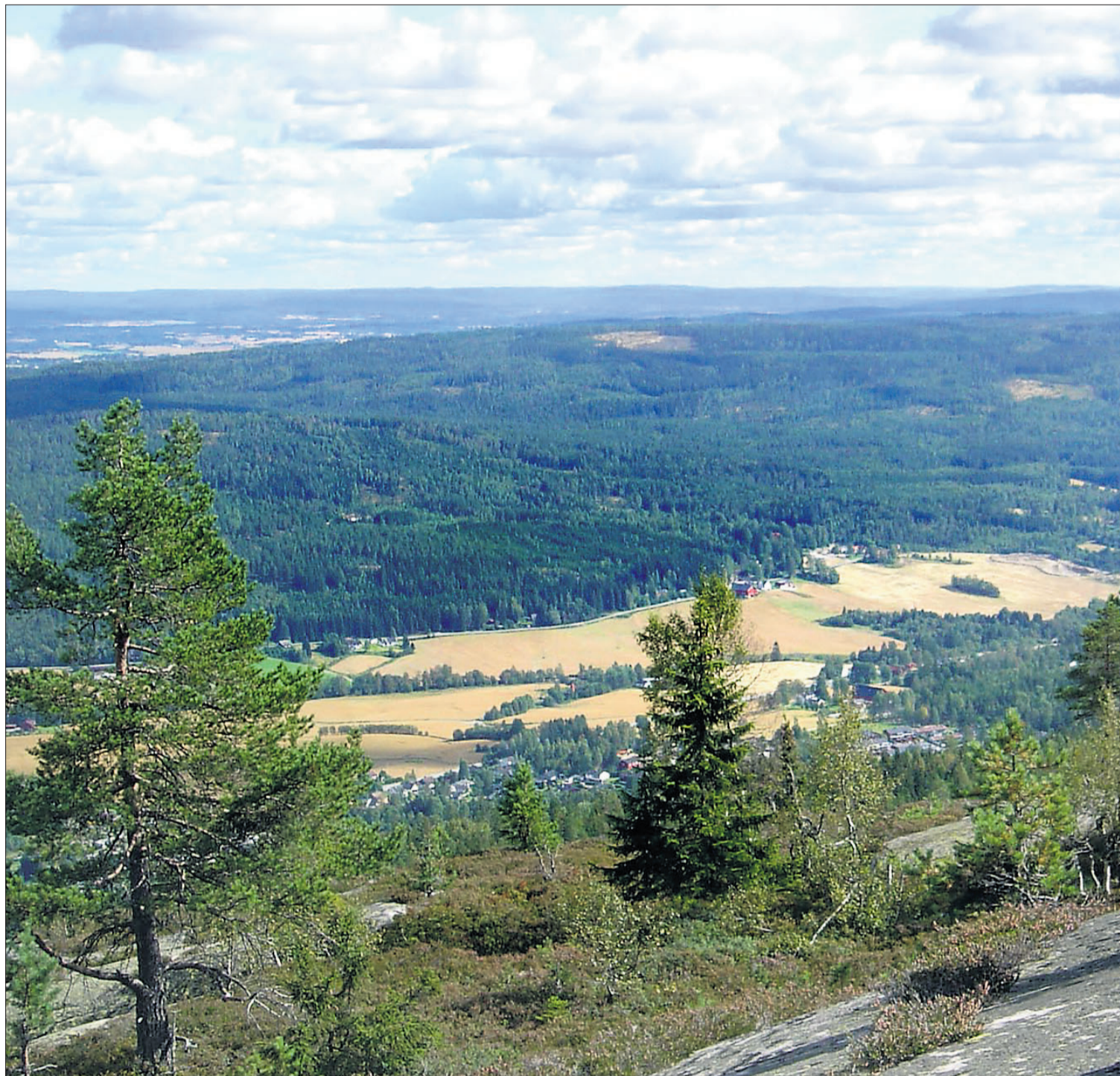
VID UTSIKT. Utsikten over Hakadal, og med Romerike og Kjølén i horisonten, er formidabel.