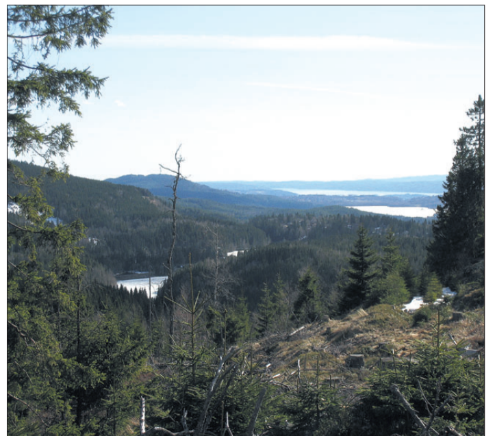
FJORDUTSIKT. Fra Laskerudåsen ser vi både Movann, Maridalsvannet og Bunnefjorden.