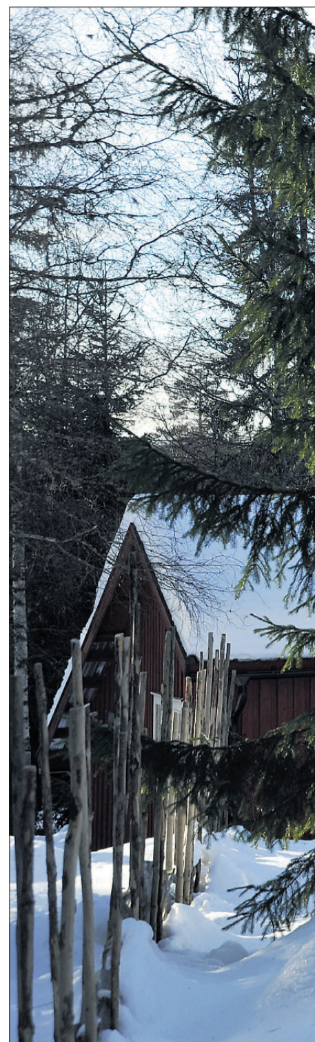
HER ER DET RO. I den vesle koia på

Her hviler sinnbildet på mangfoldet i den norske skogsnaturen; furumoer og bjørkelier, steinfluer og koller, om sommeren stille tjern og iltre bekkelast, ro og sindighet forenet med lavmælt villskap. Stø og trygge står tilårskomne graner og trauste malmfuruer. Rikker seg ikke en tomme om hele verden forgår.