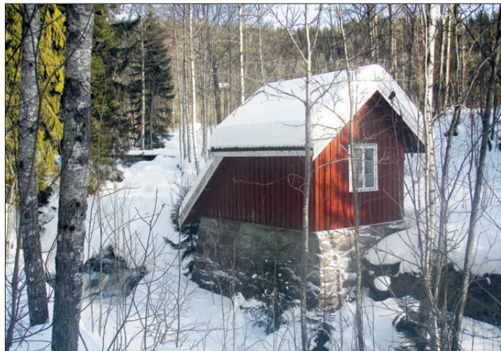
KRAFTVERK. På Aas gård finner vi Norges første private kraftverk, bygget i 1885.

Nøkleby betyr den store gården (Myklabyr). Gårdene ligger på hver sin side av Elnesveien. På Søndre Nøkleby har eieren fått kommunens kulturpris for å ha restaurert gården i tråd med byggeskikken fra den tiden husene rundt dette