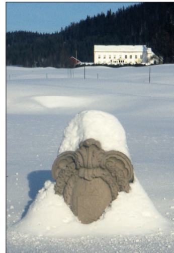
AAS GÅRD. Den staselige gården i Hakadal, sett fra sør.