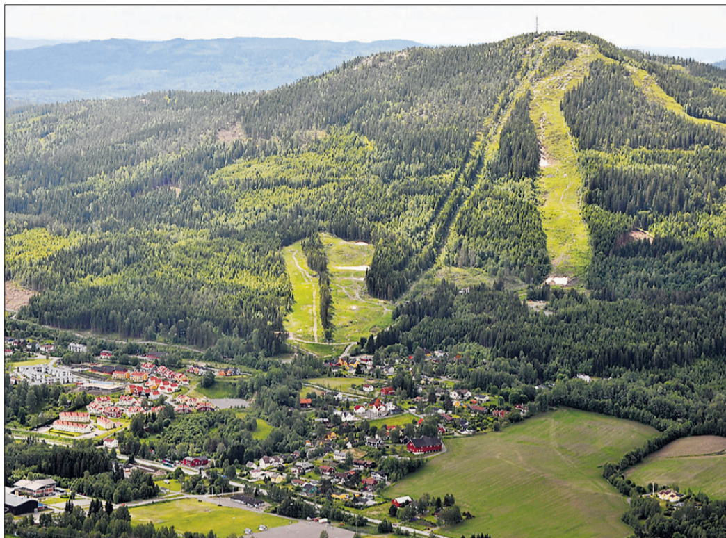
VARINGSKOLLEN FØRST. Den første av de fem planlagte toppturene går søndag 5. juni. Da skal Veslekollen og Varingskollen bestiges, topper på henholdsvis 411 og 546 meter. Turen går fra parkeringsplassen i Varingskollen.