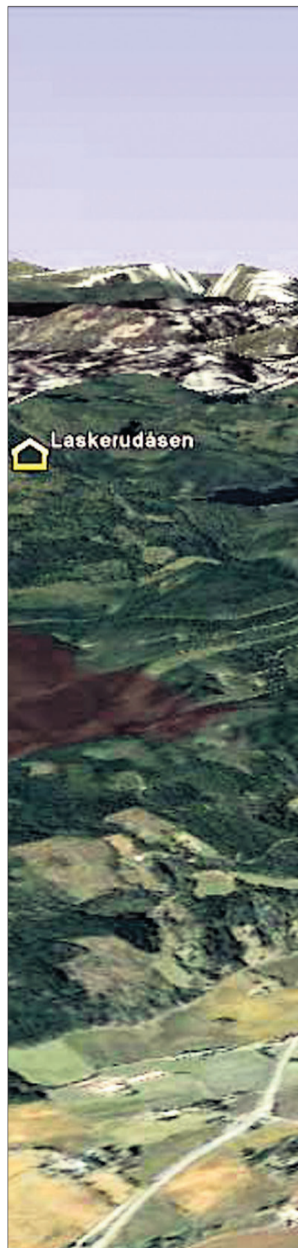
TURMÅLENE. Her ser du hvordan

finne ut hvilken skole, klasse eller arbeidsplass som stiller med flest deltakere. Har du ikke PC, ta kontakt med en av turlederne, og vi vil hjelpe deg med registrering.